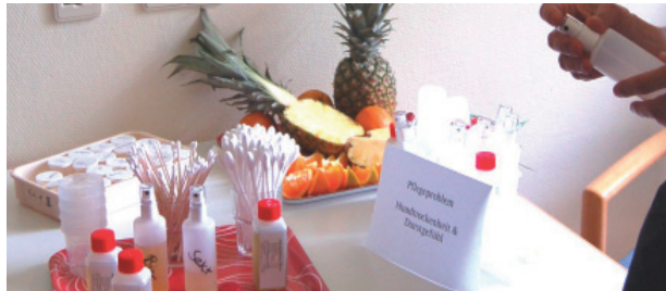
Frische gefrorene mundgerechte Obststücke, selbst hergestellt, helfen den Schwerkranken gegen Mundtrockenheit und Durstgefühl.

Ist eine Entlassung in den häuslichen Bereich nicht realisierbar, bemühen wir uns um eine Weiterbetreuung in einem stationären Hospiz, einer ambulant betreuten Hospizwohnung oder einer stationären Pflegeeinrichtung.