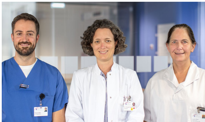
Interdisziplinäre Teamarbeit bestimmt den Klinikalltag

Digitalisierung bietet – wenn sie gut durchdacht und umgesetzt wird – ein enormes Potenzial bei der Unterstützung unserer Tätigkeiten. Das fängt bei der schnellen Verfügbarkeit wichtiger medizinischer Daten an, geht über die Unterstützung bei Medikamentensicherheit bis hin zum praktischen Effekt, dass nun alle für die Patient:innen Verantwortlichen Informationen untereinander automatisch digital teilen.